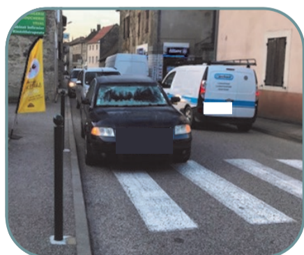
Circulation gênée dans les 2 sens